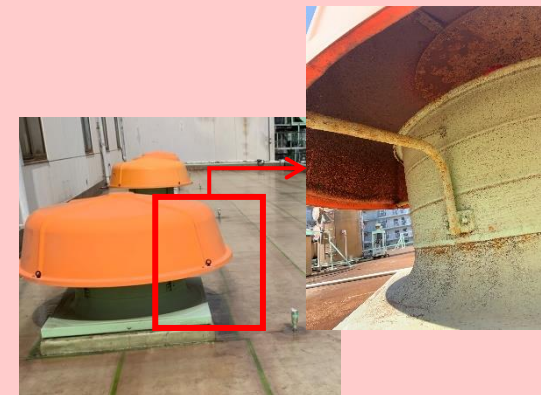
硝酸槽排気カバー (屋外)